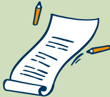
Starta eller skriv på ett medborgarinitiativ