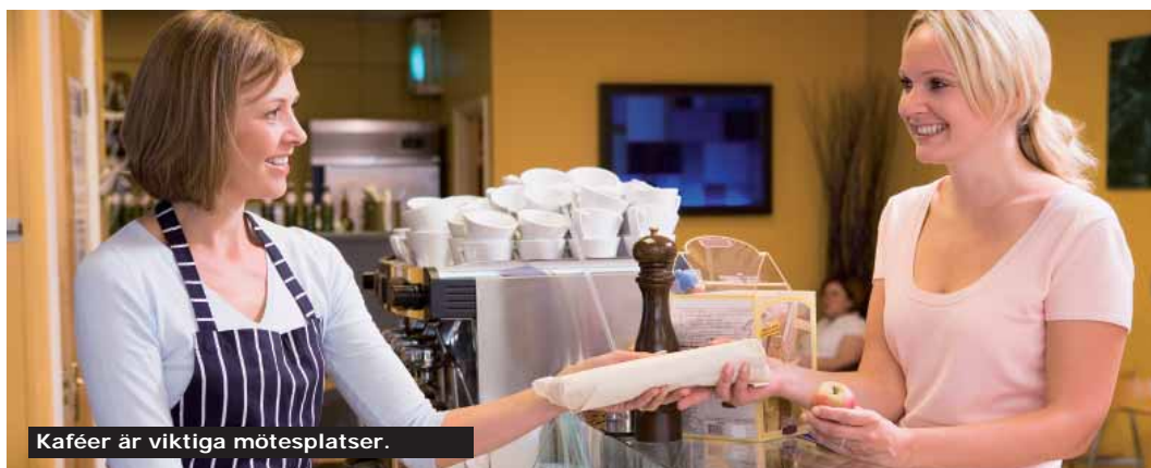
Kaféer är viktiga mötesplatser.